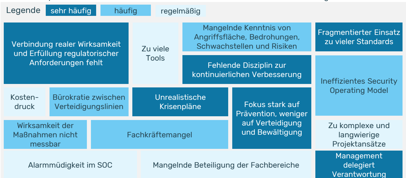
Abb. 1: Typische Symptomatik

Wir unterstützen unsere Kunden seit langen Jahren in den Themen IT Compliance, Risiko und Sicherheit. Hinsichtlich Cyber Resilienz sehen wir dabei aktuell immer wieder ähnliche Herausforderungen.