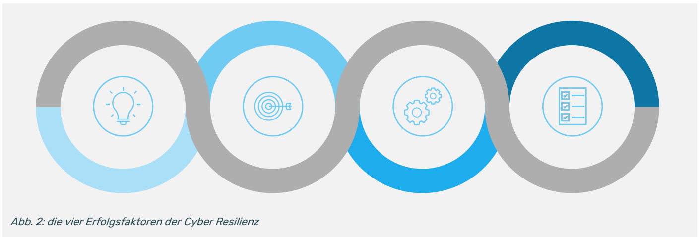
Abb. 2: die vier Erfolgsfaktoren der Cyber Resilienz