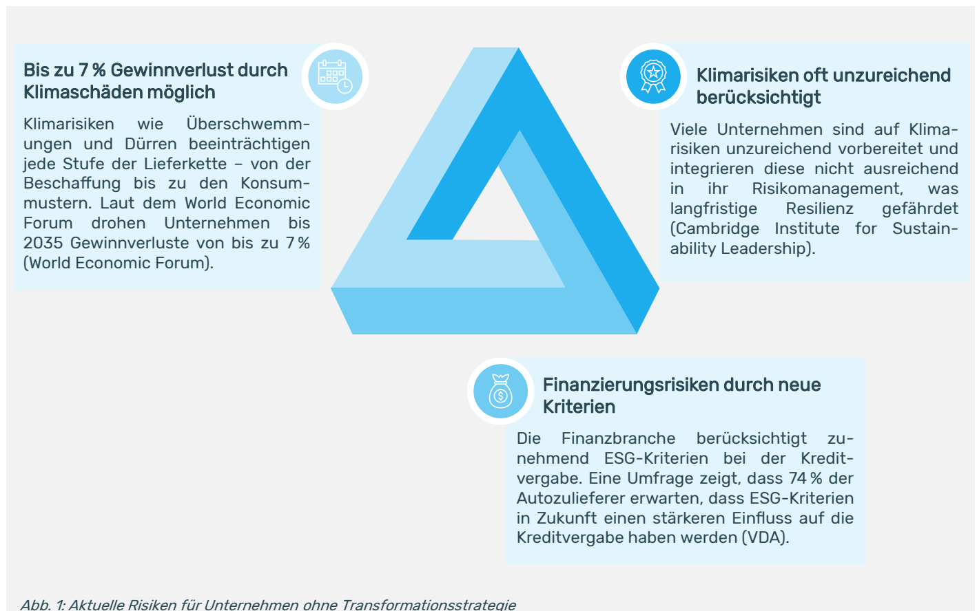
Abb. 1: Aktuelle Risiken für Unternehmen ohne Transformationsstrategie

In Abbildung 1 werden einzelne Risikobereiche aufgezeigt.