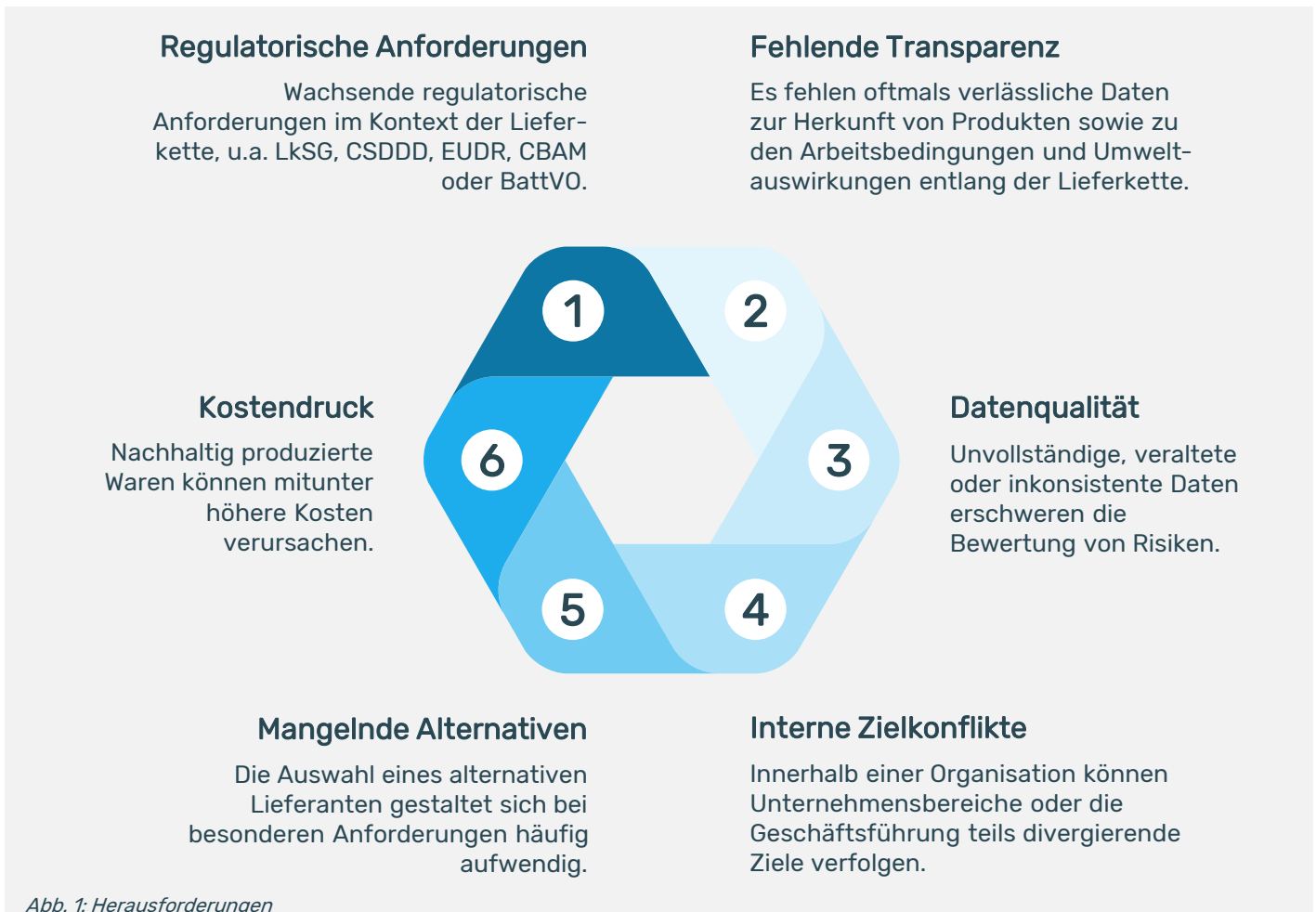
Abb. 1: Herausforderungen